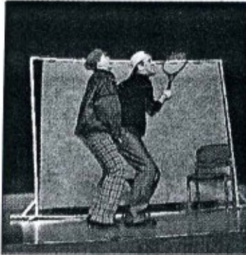
Situationen, die Kinder kennen